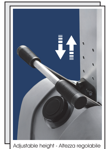
Adjustable height - Altezza regolabile